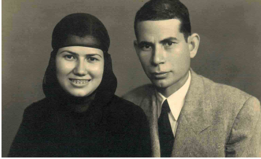
بعد عقد القران مع زوجها