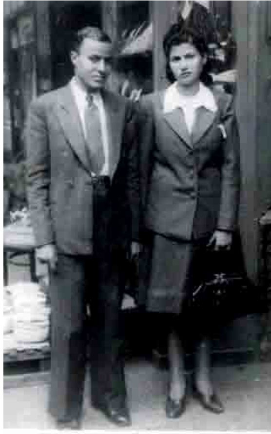
أخذت هذه الصورة في ٩ يناير سنة ١٩٤٦ قبل عقد قرانها بيوم