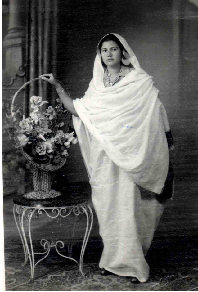
الشقيقة فوزية بالزي السوداني وقد كتبت على ظهرها "إلى أمي العزيزة مع أسعد تحياتي" الخرطوم ١٩٥٧/٢/١٠