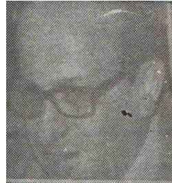
الأستاذ الدكتور محمد حلمي مراد

المحاضر بالمؤسسة والمعاهد والجامعة منذ تكوينها حتى الآن صاحب المؤلفات العديدة الرئيس المؤسس للاتحاد الإسلامي الدولي للعمل