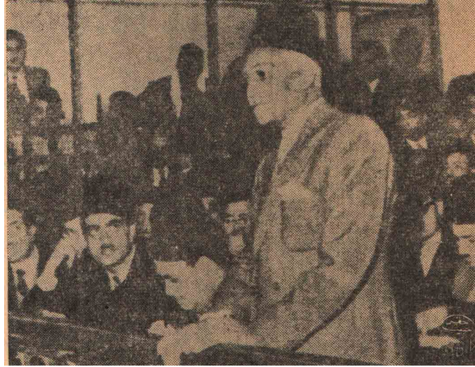
السيد اللواء أحمد فؤاد صادق باشا يدلي بشهادته أمام المحكمة

س: نريد أن نعرف رأي سعادتكم بصفقتكم قائد عام لحملة فلسطين عن موقف الإخوان المتطوعين في هذه الحرب وفي ميدانها ؟