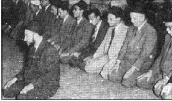
التقطت هذه الصورة للمرحوم حسن البنا بجمعية الشبان المسلمين يوم المصلين حين حل موعد الصلاة قبل اغتياله مساء ١٢ فبراير عام ١٩٤٩م

بعد مقتل النقراشي بيد شاب إخواني تولى إبراهيم عبد الهادي رئاسة الوزارة فاستهل حكمه بالثأر من قتلة النقراشي والتكيل بالإخوان المسلمين والقبض على معظمهم باستثناء حسن البنا الذي أدان جريمة القتل وأعلن أن دعوته سبيلها الالتزام بتعاليم الدين دون الالتجاء إلى العنف والقتل، ورغم ذلك فقد اغتيل حسن البنا مساء ٢٣ فبراير سنة ١٩٤٩م عقب خروجه من جمعية الشبان المسلمين، وكان يتردد عليها للقاء زملاء له خصوصاً وأن الجمعية كانت مركزاً للكشف والتدريب وفحص المتطوعين للحرب ضد الصهاينة.